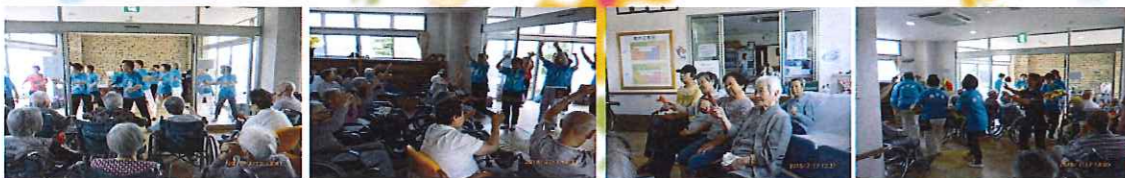
クラブ活動・よさこいフレンズ