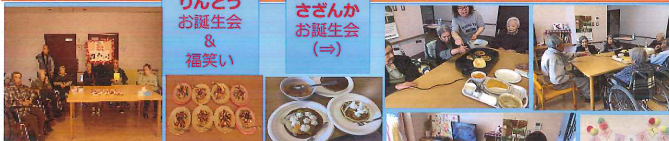
りんどう お誕生会 & 福笑い