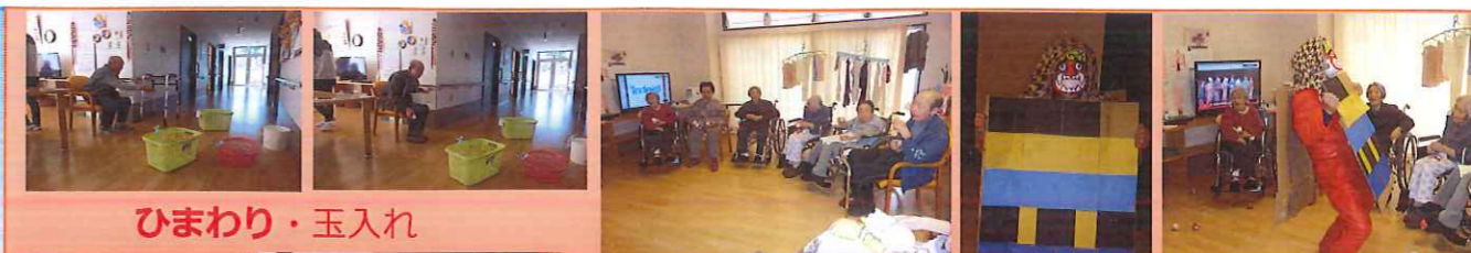
ひまわり・玉入れ