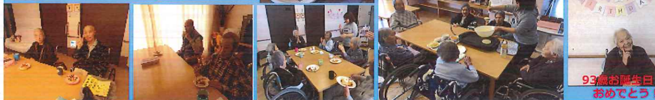
93歳お誕生日 おめでとう!