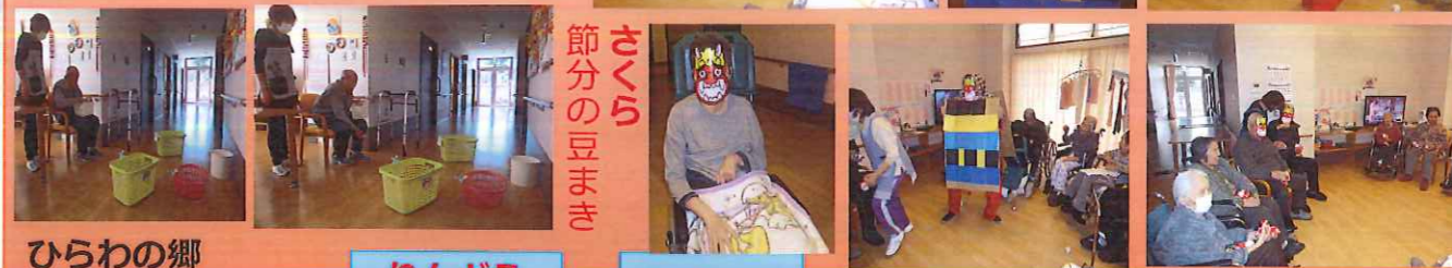
さくら 節分の豆まき