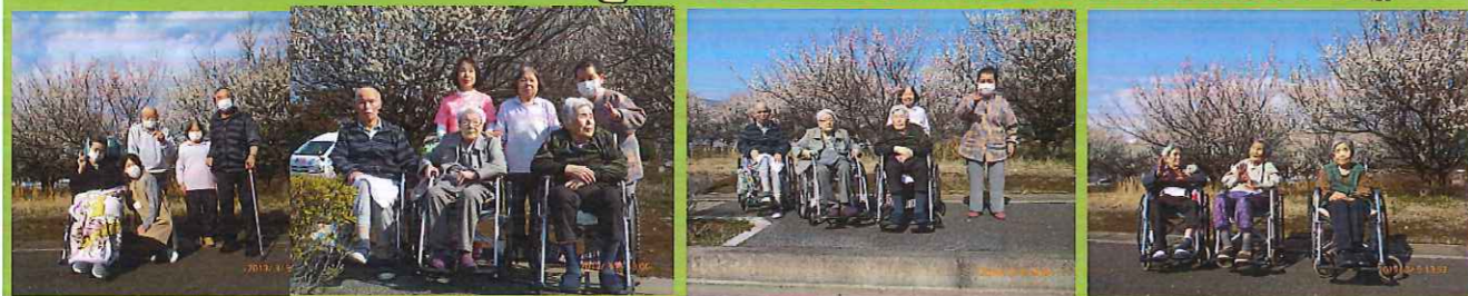
↓うめの花を見に行きました。ぽっかぽっか