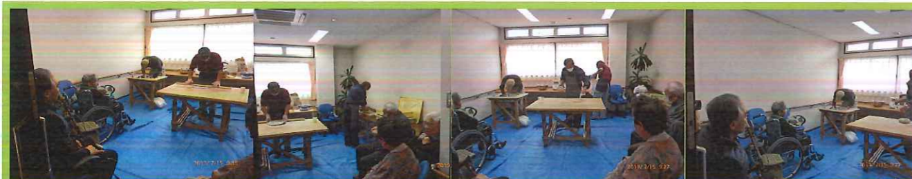
蕎麦打ち見学、美味しく頂きました↑