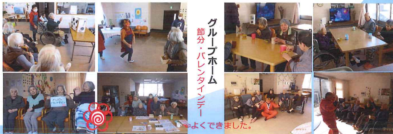
グループホーム 節分・パレンタイム デー