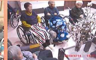
いいだの郷 いろいろなところで お花見しました♪