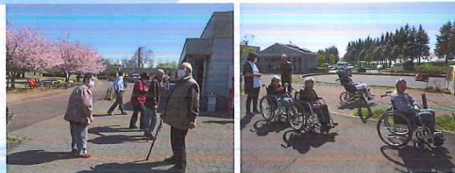
桜と鯉のぼりを見に行きました。 皆さんの楽しそうな笑顔！