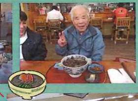
蕎麦屋【横網みこし】へ