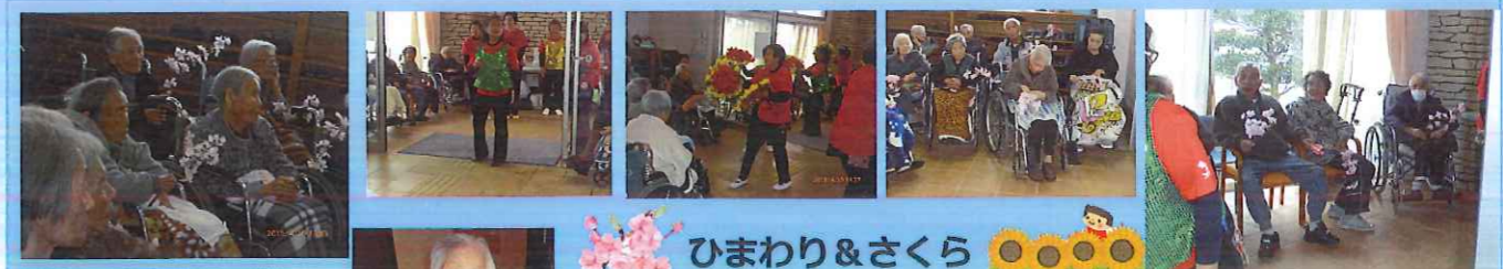
ひまわり&さくら よさこい&誕生会