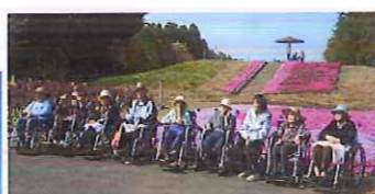
野木・若の原農村公園