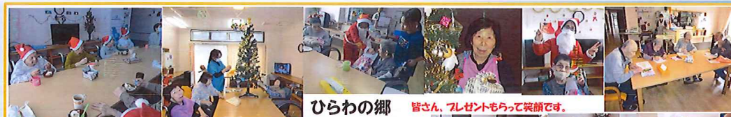
ひらわの郷 皆さん、プレゼントもらって笑顔です。