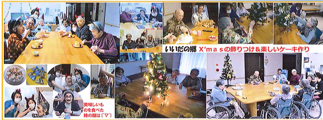
いだの郷 X'masの飾りつけ&楽しいケーキ作り