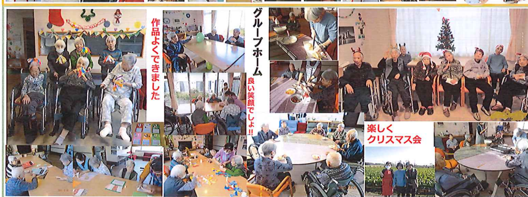
グループホーム 良い笑顔でした！！